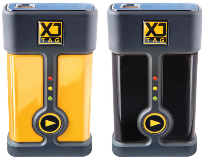
Disponible en noir et jaune (sous réserve de disponibilité).

Parce qu'il n'y a pas d'en-tête de boîte ou de brochage JTAG standard, le connecteur JTAG du XJLink2 est configurable dans le logiciel pour vous permettre de sélectionner le brochage qui convient le mieux à la carte testée. Deux des 20 broches du connecteur sont des masses fixes (broches 10 et 20), mais les signaux JTAG pour un maximum de quatre chaînes peuvent être distribués sur les autres broches selon les besoins, les broches de recharge pouvant être affectées comme E/S numériques.